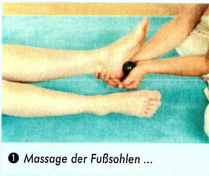
1 Massage der Fußsohlen ...