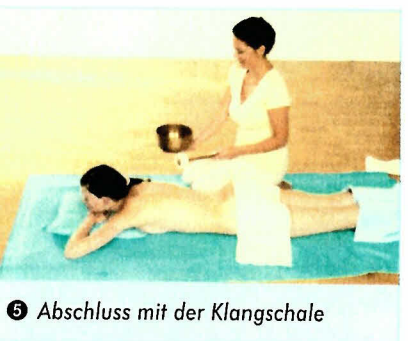
5 Abschluss mit der Klangschale

• Dann geben Sie etwas warmes Edelsteinöl auf die Hände und verteilen es auch auf den Armen. Nehmen Sie nun wieder die warme Edelsteinkugel und massieren Sie damit die Handinnenflächen (siehe Bild 2).