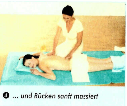
4 ... und Rücken sanft massiert