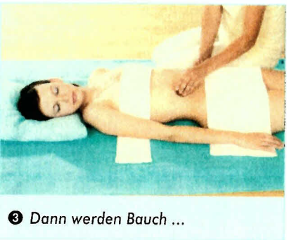
3 Dann werden Bauch ...