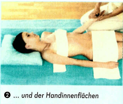
2 ... und der Handinnenflächen