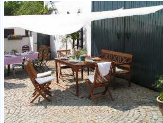
Unser Seminarhaus in Heilsbronn

Seminarinhalte unter www.edelstein-balance.de