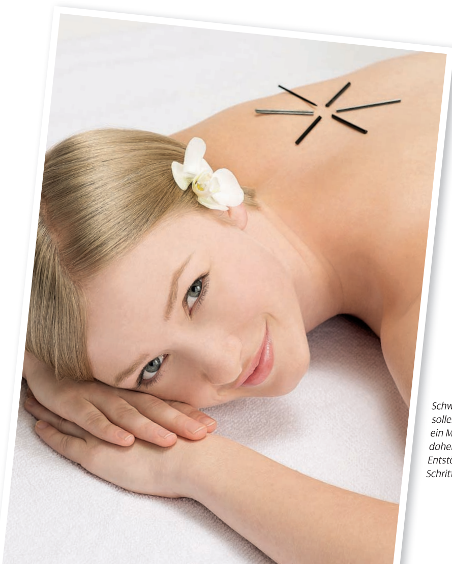
Schwarze Turmalin-Stäbchen sollen die Energie besser leiten als ein Massagestein und eignen sich daher gut für den Einsatz bei der Entstörung von Narben – beim Schritt Body-Talk Reset

Durch das „Rückerinnern“ können mit dem Bergkristall die Wurzeln vieler