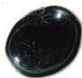
Turmalin spendet neue Energie