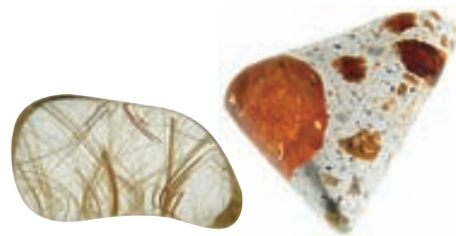
Rutilquarz und Feueropal wirken positiv auf die Stimmung