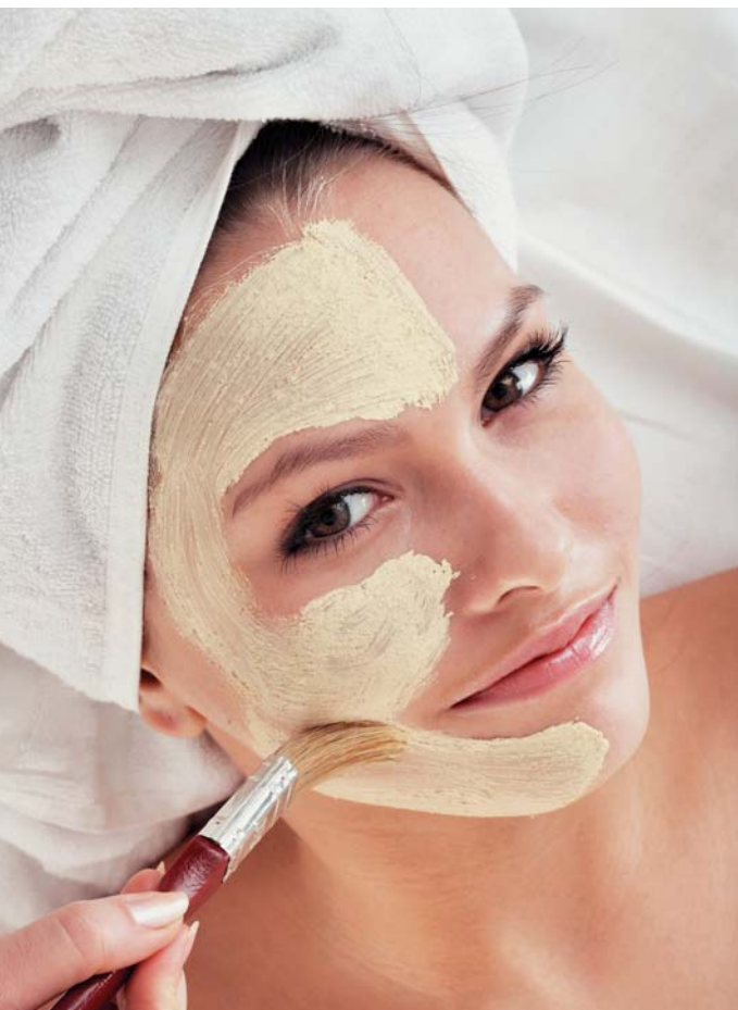
Süß und intensiv pflegend: die Maske mit Bernstein, Honig und Kreide

Ein neues Freiheitsgefühl: Peeling mit Bernsteinpulver und Heilkreide. Dazu ca. 1 TL Kreide mit 1 TL Wasser verrühren,