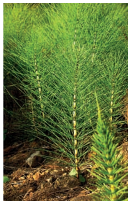
Schachtelhalm ist reich an Silizium und durch seinen verschachtelten Aufbau extrem stabil

Verrühren Sie die Bestandteile mit natürlichem Siliceageel oder Aloe-vera-Gel und weißer Heilerde, bis alles eine kuchenartigähnliche Konsistenz hat. Idealerweise mischen Sie Bergkristall-Tonic oder angesetztes Bergkristallwasser dazu, mit dem Sie auch die Haut vorbereiten.